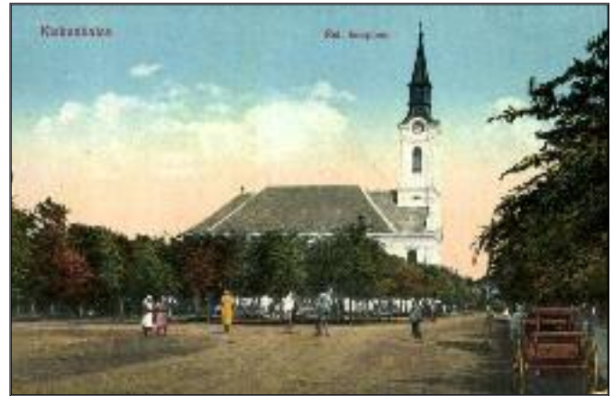
Kiskunhalas református temploma. 1910 körül.

A Magyar Garabonciás Szövetség 50/33 jubileumi találkozóját Nagykönyvesen tartja meg 2022. augusztus 14-én, vasárnap a Desseweff-kúria udvarában. www.garabonciasok.hu