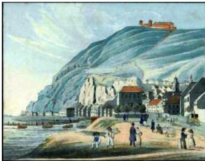
Szt. Gellért hegye és azon a Csillagvizsgálótorny, 1837k. Gróf Vasquez Károly rajza.

góta sajnosan érzett s panaszlott alkalmatlanság, mely jövőendőben a Városok terjedésével s a toronyórák szaporodásával még inkább nevedkedett volna. ”