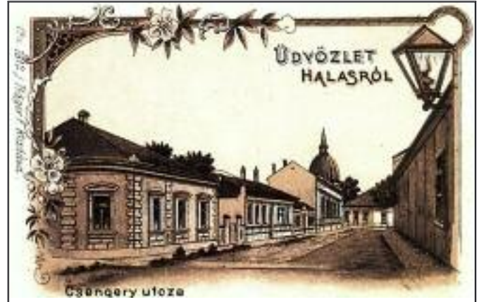
Kiskunhalas: Csengery utca 1912-ben Jelenleg: Sétáló utca (Práger Nyomda)

VÁROSI LOKÁLPATRIÓTA EGYÜTTMŰKÖDÉS 6400 Kiskunhalas, Hősök tere 2. www.sziladyarontarsasag.hu Adószám: 18343081-1-03