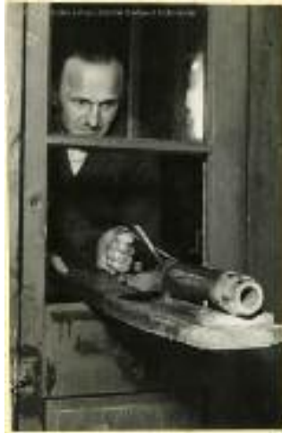
Az ágyú elsütése

képpen a következő év július 15-én újra eldőrdült a mozsárágyú, de most már egy elektromos szerkezet automatikusan sütötte el.