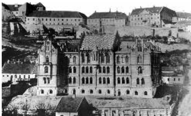
A budai Állami Főreáliskola, melynek bal oldali erkélyéről sütötték el mindennap a delet jelző ágyút.

A harang 1849-ben bombatalálatot kapott és működésképtelen lett, később Pest városa újjáöntette. A csillagdai épületet 1866-ban átvette a katonaság, ezért az időjelzésre odatelepített műszereket és a harangot elszállították, ezért ott megszűnt a déli idő jelzése. Amikor a katonaság átvette a Csillagda épületét