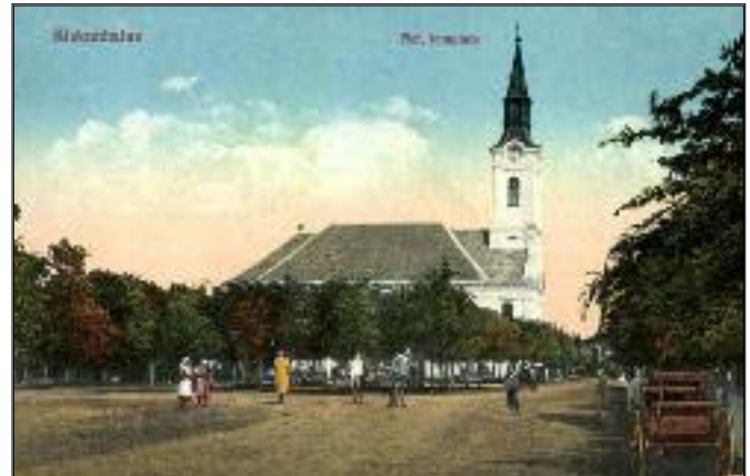
Kiskunhalas, református templom 1910 évek körül Kozma Attila gyűjteményéből.