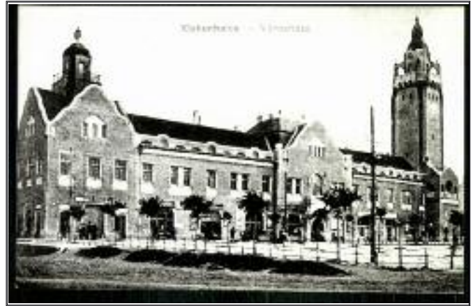
Kiskunhalas, Városháza 1920 körül